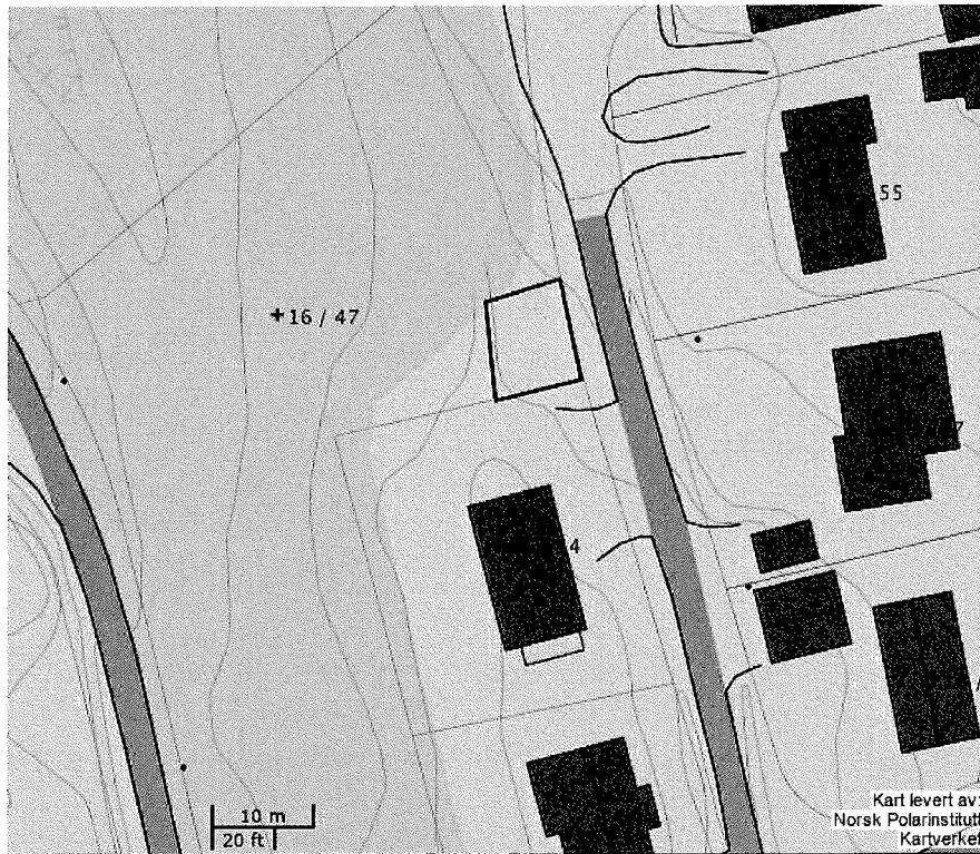
Figur 1: Areal som ønskes kjøpt markert med sort strek.