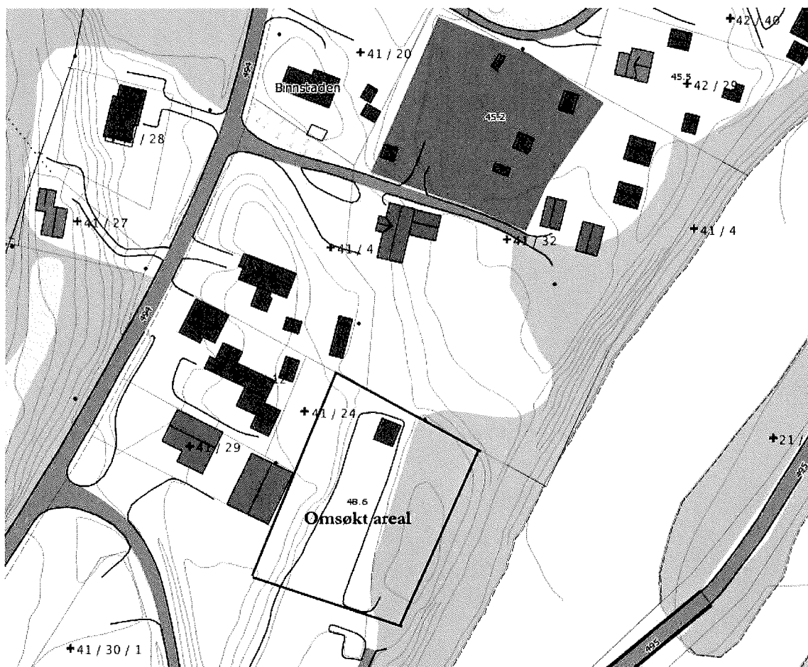
Figur 2: Kartet viser hvilket areal som ønskes kjøpt.