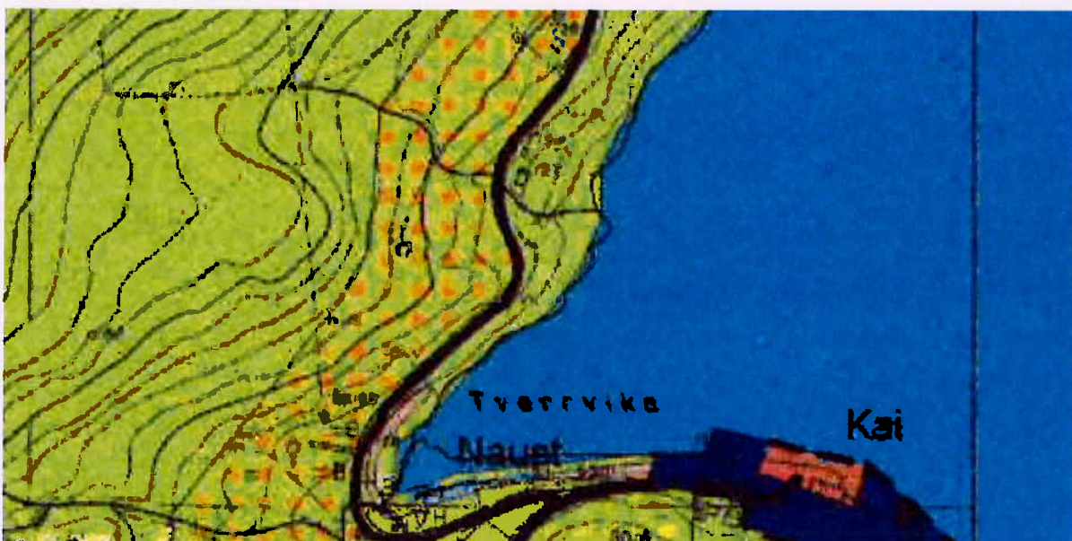
Figur 2: Kartutsnittet viser planstatusen i området, formål fritidsbebyggelse markert med oransje prikker.

Hva gjelder hensynet til fritidsbebyggelse kan dette vanskelig sees å bli vesentlig tilsidesatt ut fra tiltakets plassering mellom kommunal vei og bebygd fritidstomt. Tiltakshaver begrunner søknaden med personlig behov for universell utforming, og trekker frem at tiltaket vil kunne lette adkomsten for eventuelle andre hyttebyggere i området.