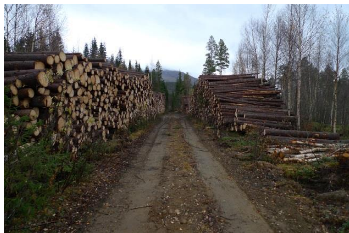
Det er et stort potensiale i skog i Beiarn.