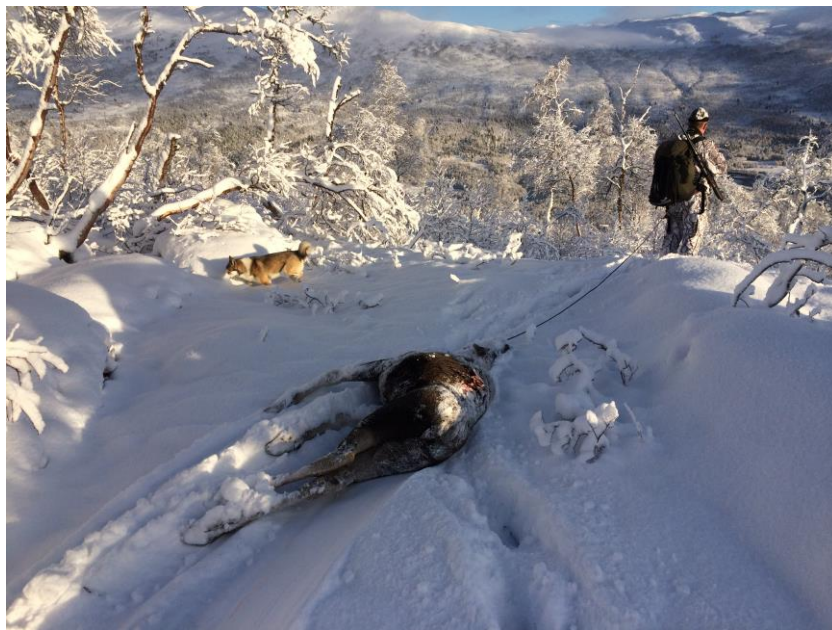
Hjortevilt kan nyttes i næringsssammenheng.