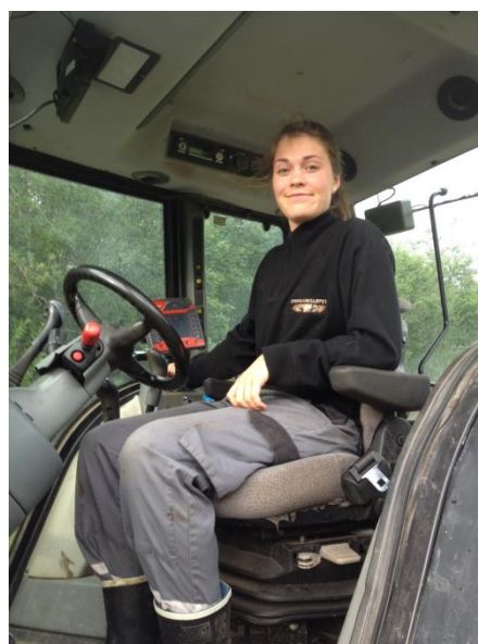
Satse på ungdommen.