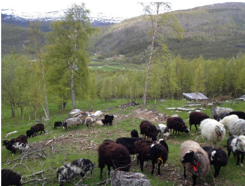
Utnytte landbrukseiendommenes naturgitte ressurser. (Bilde AMW).

Produksjonsmål: Øke melke- og kjøttproduksjonen med 10 % i planperioden.