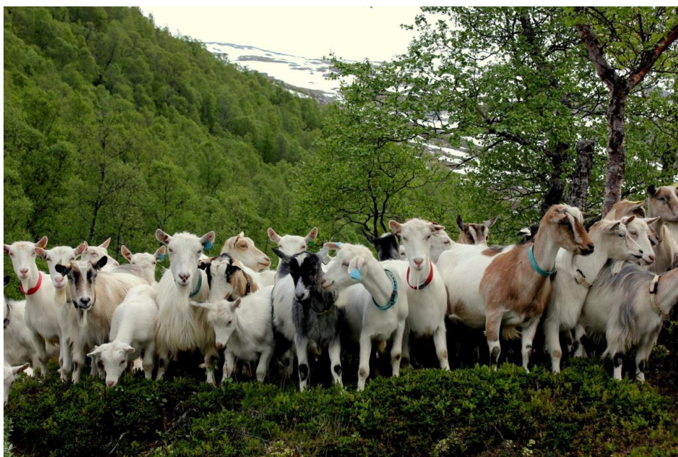
Sørge for at geita og bonden trives i Beiardalen.