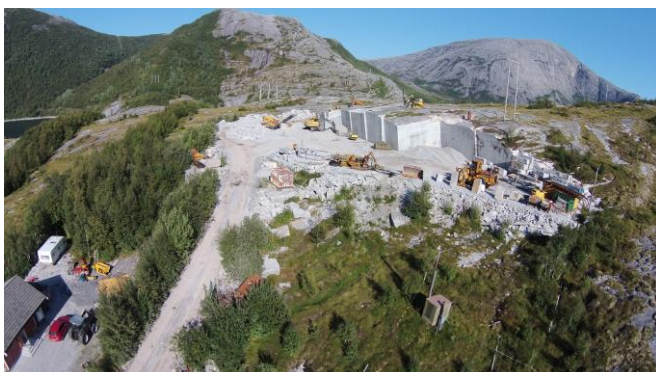
Evjen granitt.