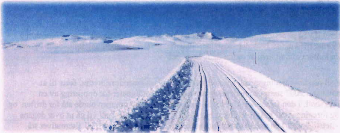
Ny skitrasé på Beiarfjellet

Planlagte og prioriterte anlegg sorteres under kategoriene ordinære anlegg, nærmiljøanlegg og kulturhus, jf. veileder for tilskudd til anlegg for idrett og fysisk aktivitet, KKD V-0732. Kommunen må i hver av kategoriene vurdere planlagte anlegg / tiltak i anlegg opp mot hverandre og gi de enkelte anlegg og tiltak ulik prioritet. Det gjøres i henhold til hvor langt man er kommet i ansvarsforhold, utredning, kostnadsvurdering og budsjettering. I tillegg er det viktig at de anlegg som har mottatt deler av søkt tilskuddssum blir beholdt i prioritert handlingsplan, til hele søknadssummen er utløst. Få anlegg har pr i dag ferdig utredet kostnader og i utgangen av 2014 er man ikke forprosjektering ferdigstilt.