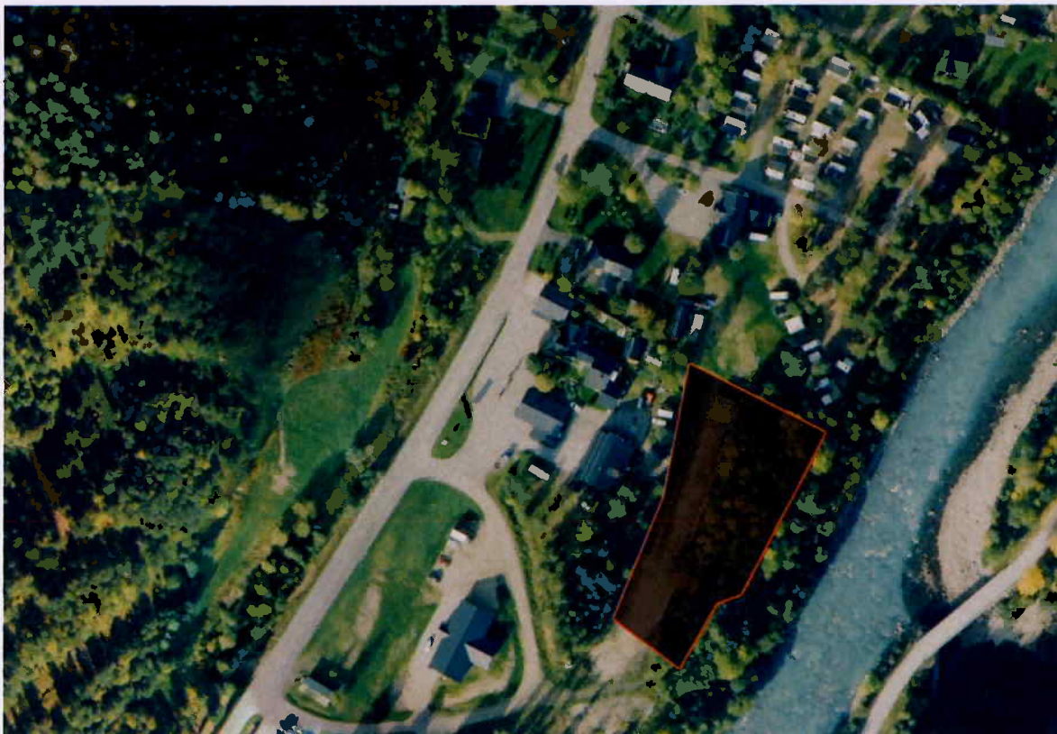
Figur 2: Arealet som søkes ervervet av Nye Beiarn Turistsenter.

Beiarn kommune har omregulert arealet for drift sammen med Beiarn Turistsenter. Arealet kan dermed leies ut så lenge det drives sammen med Turistsenteret, eller legges til samme eiendom som Turistsenteret gjennom arealoverføring.