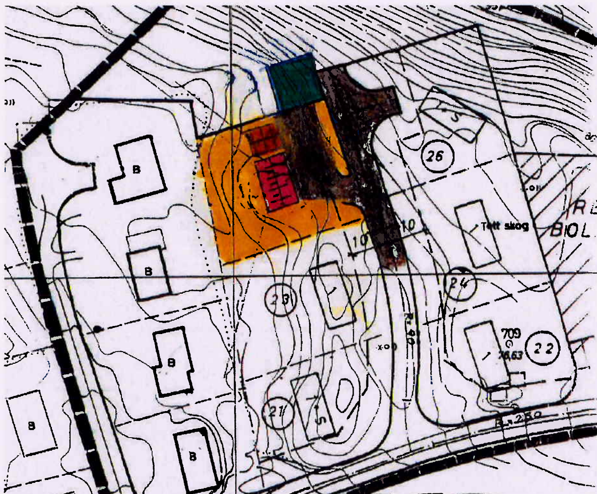
Figur 1: Omsøkt tilleggstomt markert med grønt.