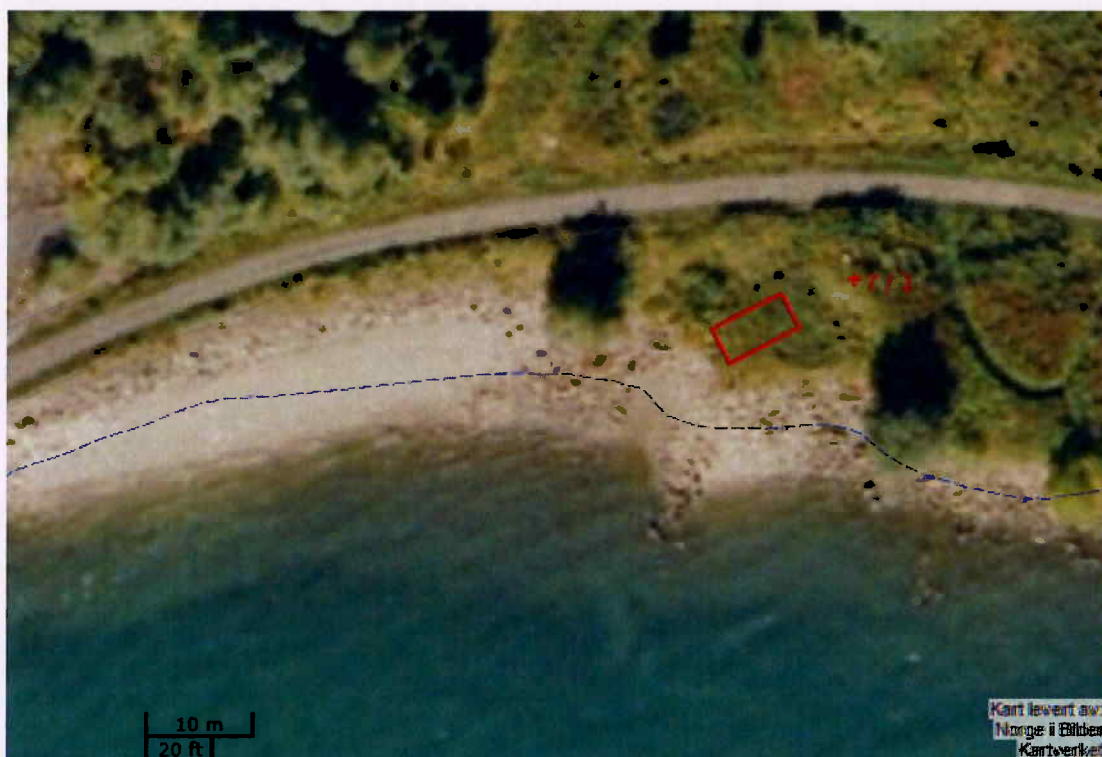
Figur 4: Omsøkt plassering av tiltaket.

Roger Nordland søkte 25. april om dispensasjon for bygging av 36 m 2 (8 x 4,5 meter) naust på Nordland. Med søknaden var kart og tegninger.