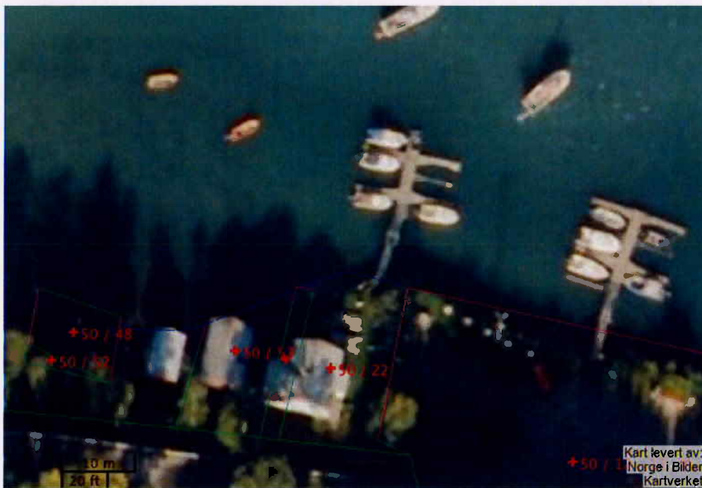
Figur 1: Flyfoto viser at dagens brygge ender utenfor marbakken.

Kjell Larsen og Kurt Edvin Blix Hansen søkte 29. mai om tillatelse til 9 meter forlengelse av flytebrygge, på vegne av Tverrvik Bryggelag 1. Søknaden er ikke fullstendig.