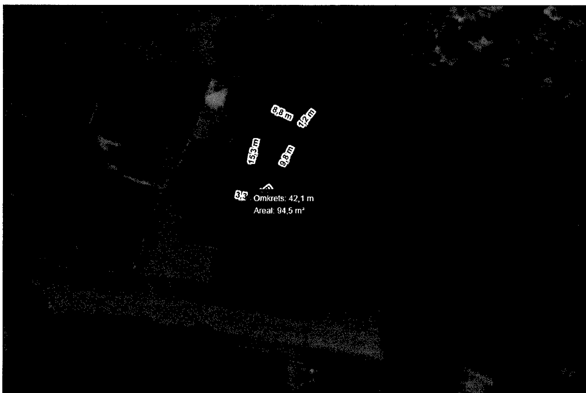
Figur 1: Utsnitt av kart som viser hvilket areal som er aktuelt å selge.

Vedtaket begrunnes med at arealet har vært lagt ut parkering uten at det har blitt opparbeidet i 7 år. Arealet som selges vil ikke være nærmest veien, og dermed ikke hindre eventuell fremtidig utvidelse av parkeringen.