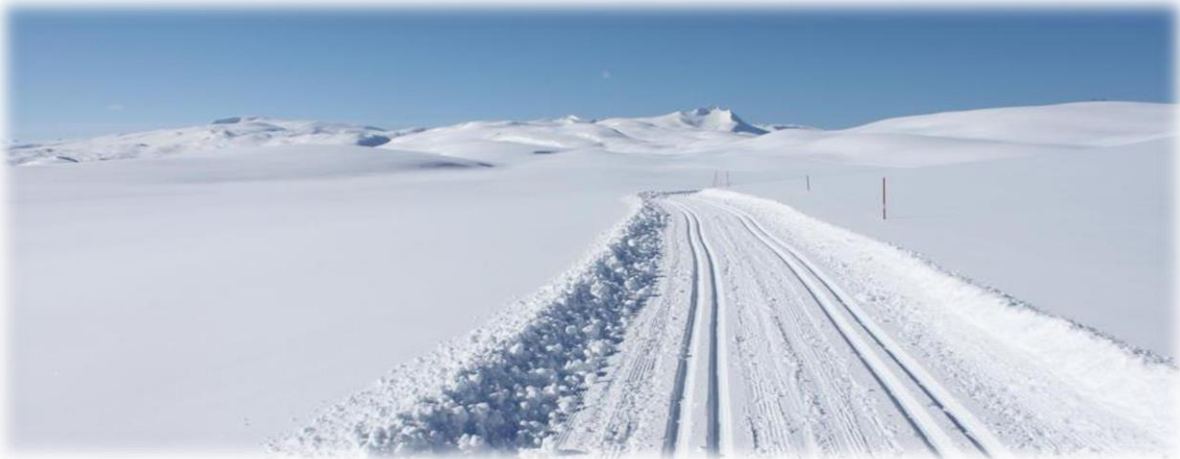
Ny skitrasé på Beiarfjellet

Planlagte og prioriterte anlegg sorteres under kategoriene ordinære anlegg, nærmiljøanlegg og kulturhus, jf. veileder for tilskudd til anlegg for idrett og fysisk aktivitet, KKD V-0732. Kommunen må i hver av kategoriene vurdere planlagte anlegg / tiltak i anlegg opp mot hverandre og gi de enkelte anlegg og tiltak ulik prioritet. Det gjøres i henhold til hvor langt man er kommet i ansvarsforhold, utredning, kostnadsvurdering og budsjettering. I tillegg er det viktig at de anlegg som har mottatt deler av søkt tilskuddssum blir beholdt i prioritert handlingsplan, til hele søknadssummen er utløst. Få anlegg har pr i dag ferdig utredet kostnader og i utgangen av 2014 er man ikke forprosjektering ferdigstilt.