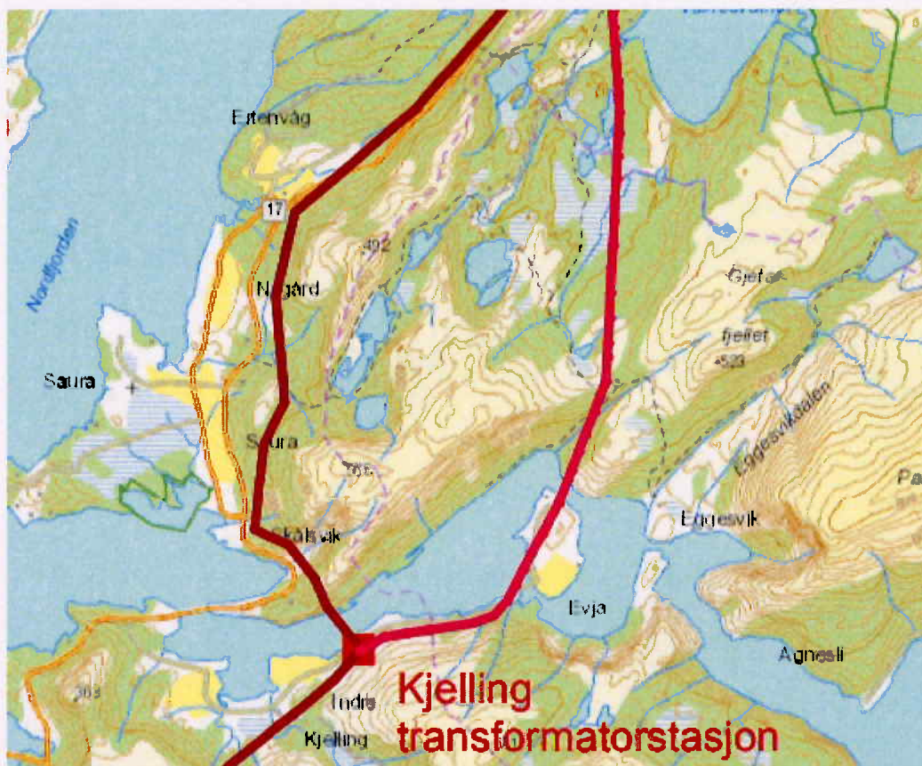
Figur 1: Alternativ 2 følger dagens trasé. Alternativ 1 går ikke innom Beiarn kommune.

Gildeskål kommune har vært forespurt om mulig samarbeid og samkjøring av høringsuttalelse, men siden administrasjonens innstilling har blitt endret av politisk vedtak er informasjonen fra Gildeskål kommune begrenset til at det er gode kommunikasjonsforhold langs dagens trasé.