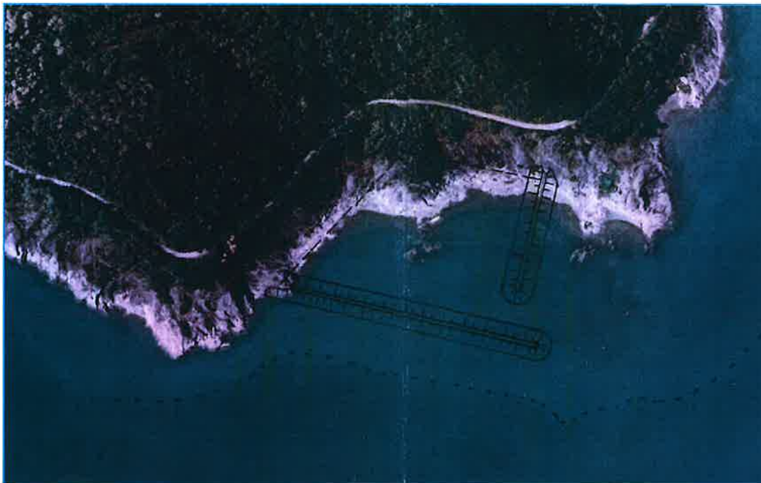
Figur 5. Skisse som viser foreløpig plassering av moloer inntegnet på flyfoto.

Det ønskes lagt til rette for ei moderne småbåthavn mellom Tarneset og Nesodden med molo for avskjerming mot vær og vind, naust, båtutsett, båtplasser og tilhørende adkomst iht. skissene nedenfor. Det poengteres at dette er skisser i en tidligfase som vil bli bearbeidet i den videre prosess.