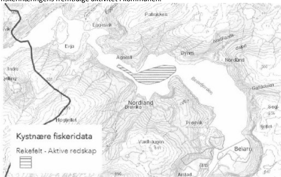
Figur 1. Registrerte fiskefelt.

For fiskeri er anbefalingen å benytte flerbruksområder uten akvakultur. Alternativt kan det benyttes hensynssoner med hensiktsmessige reguleringsbestemmelser som sikrer fiskerinæringens fremtidige aktivitet i kommunen.